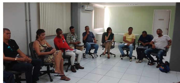
Curso de Cumim