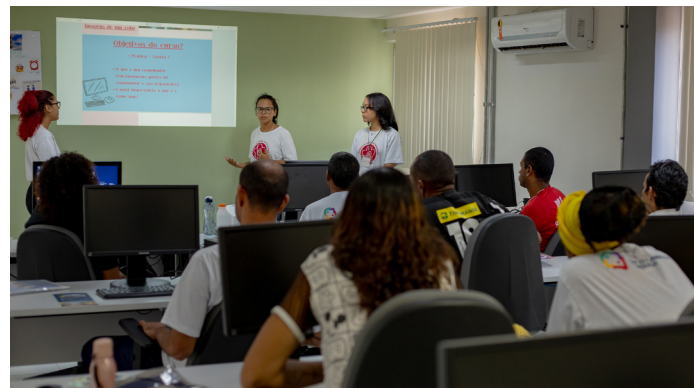
Oficina Letramento Digital em parceria com a UFPB