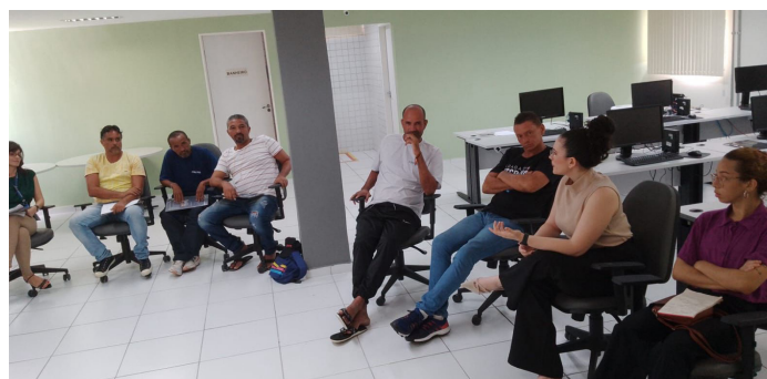
Oficina de construção de currículos em parceria com a Caixa OAB