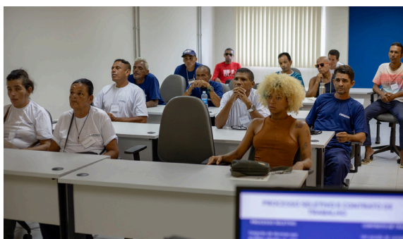
Oficina Ética no Trabalho