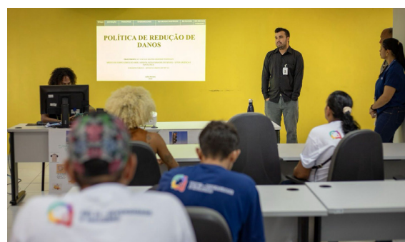
Oficina - política de redução de danos