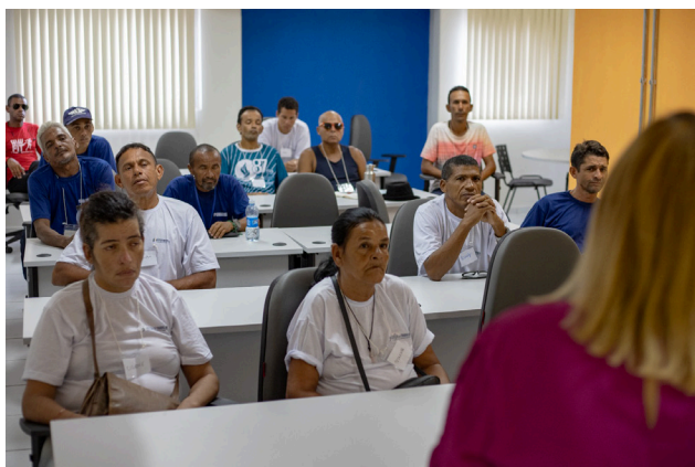
Curso em Rotinas Administrativas